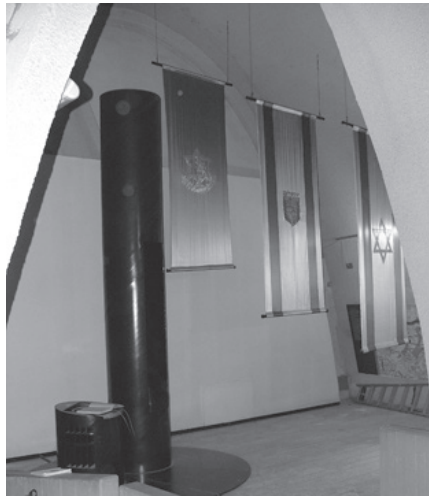
איור 1: ספר המבקרים באולם הנצחה

הספר ומסמנים אותו כארטיפקט אידאולוגי הקשור אל האתר הן מ"בחוץ" והן מ"בפנים": הספר מסומן "מבחוץ" בכך שעצם מיקומו באתר הנצחה מבנה את משמעותו ואת המשמעות של הכתיבה בו. כפי שמציינים אריק לורייר ואנגוס וייט: "מסמכים מחוברים במרחבים אותם הם משקפים" (Laurier and Whyte, 2001, para. 2.2); ו"מבפנים", בכך שהסמלים המוטבעים בעמודי הקלף יוצרים קישור אל הדגלים הממוקמים ממש מעל הספר ואל המכלול החזותי-אסתטי של סמלים לאומיים וצבאיים המעטרים את האתר לרוב. לשון אחר, נוצר רצף סמינטי דו-כיווני בין שתי זירות הנצחה: המוזאון מכאן והספר הנצחתי מכאן.